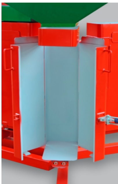
COMPARTIMENTO DO SACO PLÁSTICO