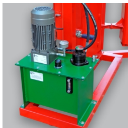
BOMBA HIDRÁULICA/MOTOR ELÉTRICO