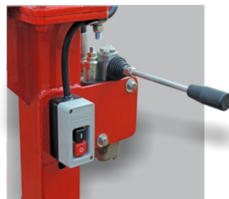
CHAVE LIGA/DESLIGA E ALAVANCA DE ACIONAMENTO