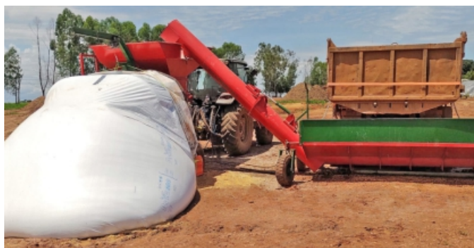
DESCARGA DIRETA DO CAMINHÃO

A Transportadora de Grãos Multiagro TGM 250 foi projetada para que o produtor, possa de maneira eficiente transferir grãos diretamente do caminhão basculante para o abastecimento da embutidora, de 6 e 9 pés.