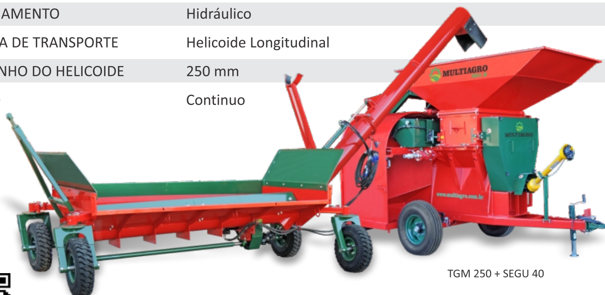
TGM 250 + SEGU 40